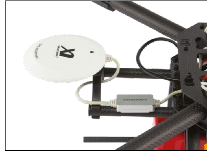
Grâce au GPS le drone peut tenir une position précise. Dank des GPS kann die Drohne eine Position präzise halten.

Das GPS ist an einen Kompass angeschlossen, womit die Drohne ihre Position jederzeit genau kennt. Zudem kann so der Startpunkt gespeichert werden und die Drohne eine automatische Landung durchführen.