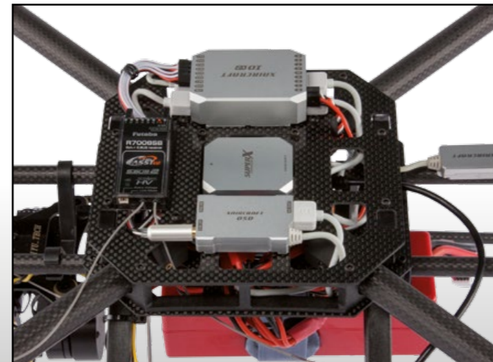
Le contrôleur de vol est équipé avec plusieurs sensors. Der Flugkontroller ist mit zahlreichen Sensoren ausgestattet.