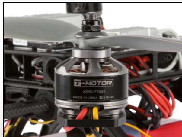
Les moteurs sont de type «brushless» Die Motoren des Typs «Brushless» der neusten Generation.

Die autonome 2-Achsen Kamerahalterung erlaubt es, während des Flugs die Kamera jederzeit in horizontaler Lage zu behalten. Dabei kann die Kameraposition von der Fernsteuerung aus verändert werden, um die Sicht zu bestimmen. Das OSD-Modul ermöglicht es, in Echtzeit Flugdaten auf den Video-Bildschirm zu übertragen, was für höchste Flugsicherheit sorgt.